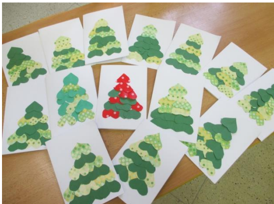
2. roč. - Německo

Ve výtvarné výchově vyrobily paní učitelky na 1.st. a paní ředitelka na 2.st. vánoční přání pro kamarády, se kterými si dopisujeme. Dle zpětných odpovědí se přáníčka moc a moc líbila a udělala radost.