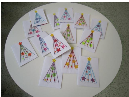
7., 8. roč. - Itálie