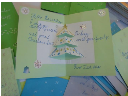
4. roč. - Švédsko