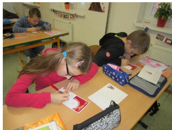
přání pro školy